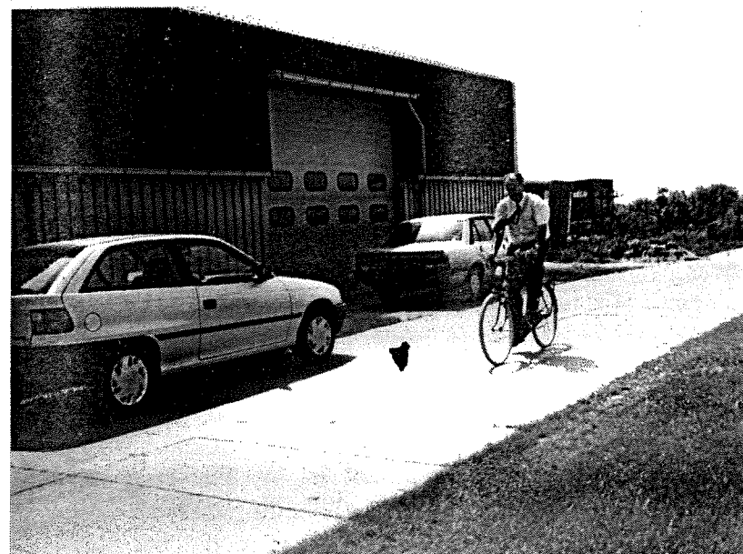
De voorzitter actief voor de leden.